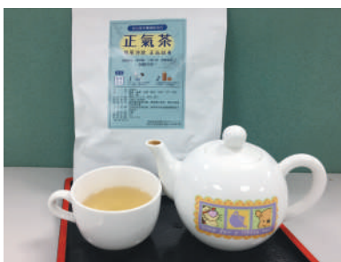
防疫養生茶飲——正氣茶