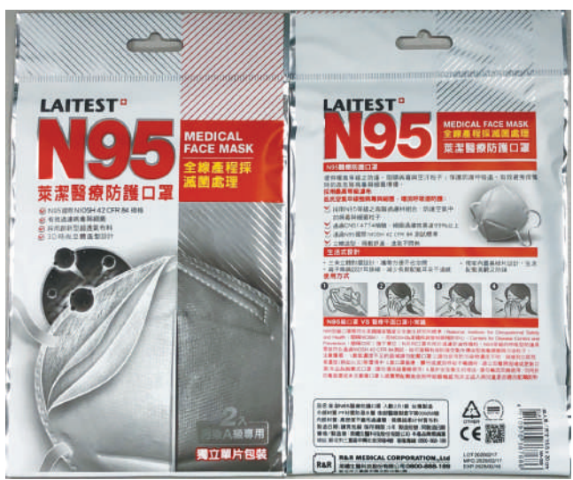
防疫物資—N95口罩（衛部醫器製壹字第006858號、製造日期：2020/02/17、有效日期：2025/02/16）