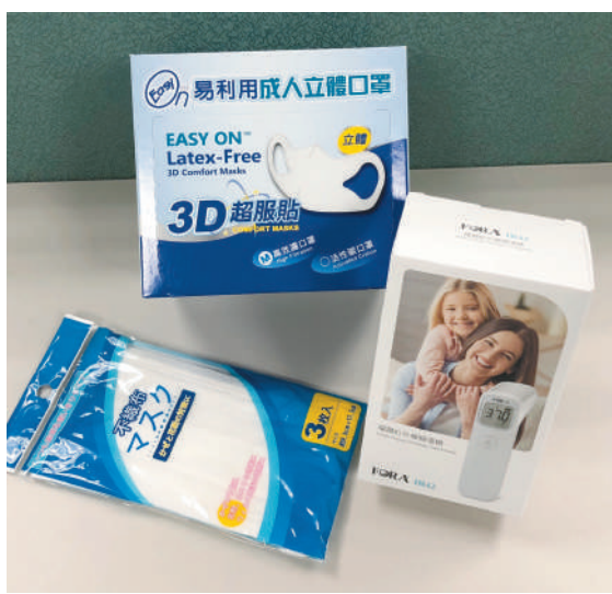
防疫物資—醫用口罩、額溫槍