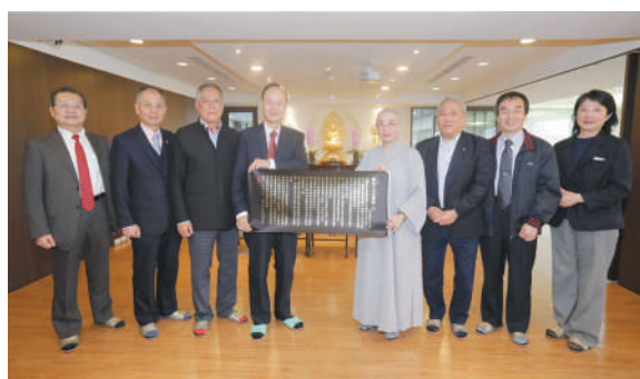
僧醫會致贈紀念品八大人覺經予台北市艋舺龍山寺

僧醫會一起做一個拋磚引玉的示範，帶動社會對醫學界人間菩薩的付出更佳的關懷！最後，我們祈願疫情早日退散、希望N95口罩可以用不上最好！」