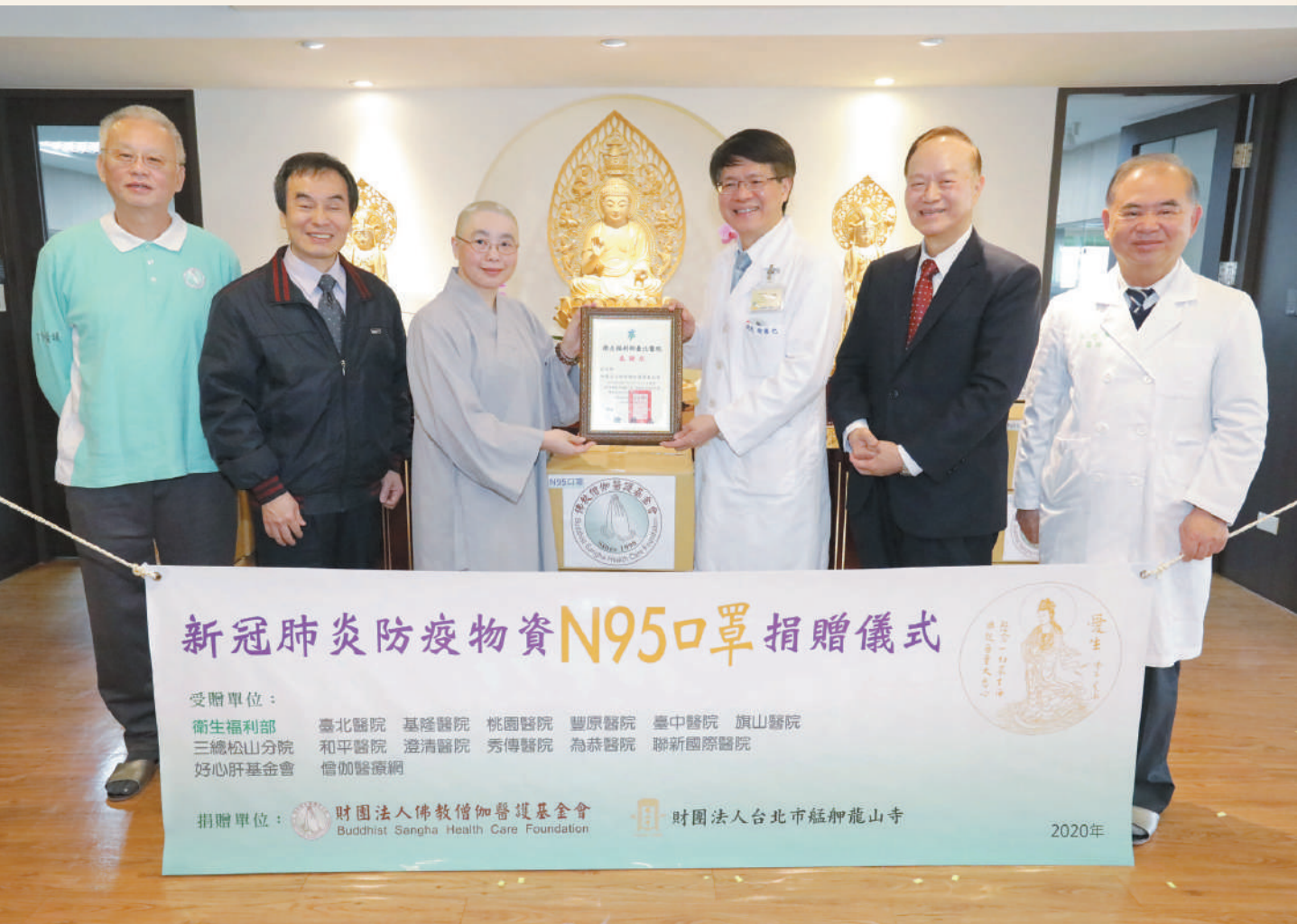
受贈單位代表——一部立臺北醫院致贈感謝狀予僧醫會

真把醫療做好！我們必定不會停下腳步，如果各位有任何的需要，我們一定會盡全力，因為這本來就是我們應該做的本份！」