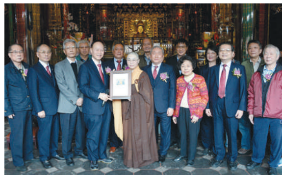
僧醫會致贈感謝狀予台北市艋舺龍山寺