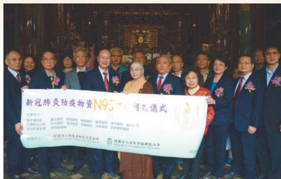
台北市艋舺龍山寺捐贈防疫物資N95口罩見證儀式

我們龍山寺的幾位董監事平常都非常關心，更因著1月18日為澳洲大火祈雨一事與僧醫會董事長慧明法師會面而得知僧醫會正發起捐贈防疫物資予第一線醫護人員的善舉，便義不容辭地加入了！台灣的醫學技術高超，我們只是盡一點微薄的力量，希望跟