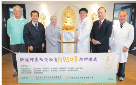
部立臺北醫院——徐錦池院長